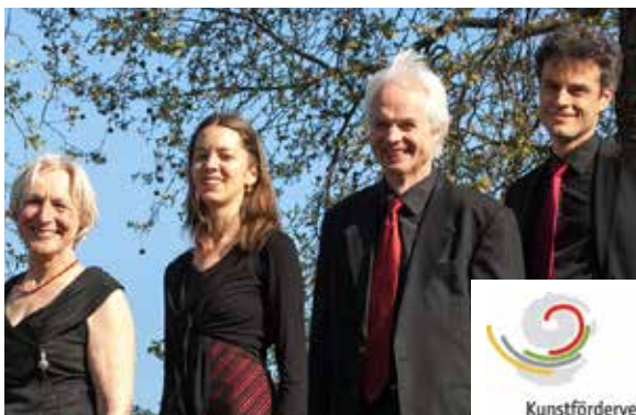
Kunstförderverein Kreis Düren e.V.

Streichquartette von Joseph Haydn, Ignaz Pleyel, Ernst Wilhelm Wolf, Adalbert Gyrowetz