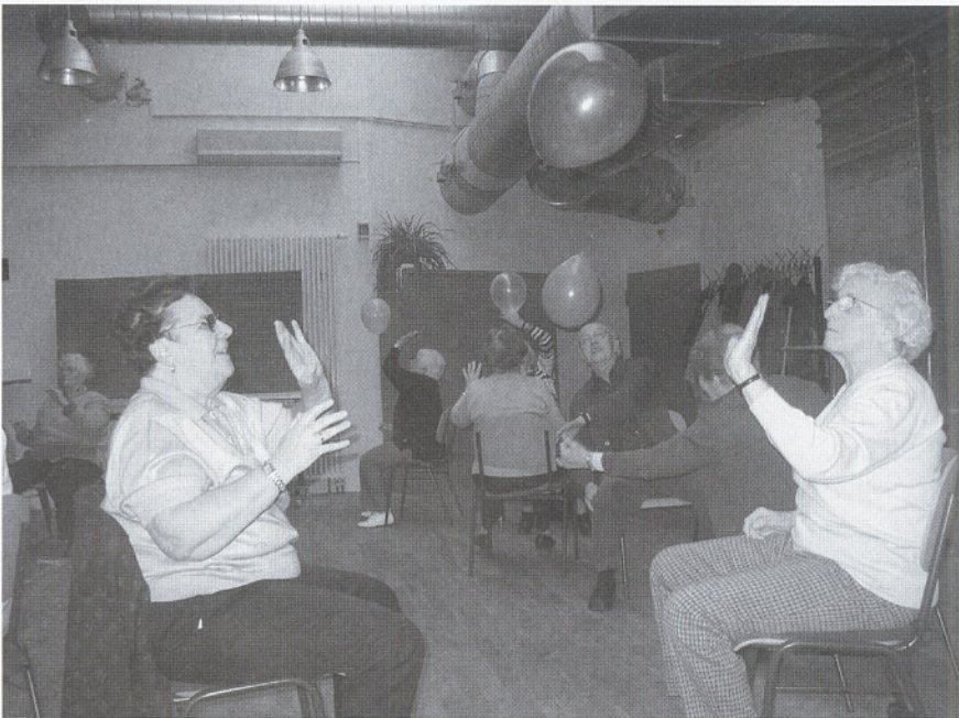
Die Gymnastikgruppe im Bürgerhaus sucht Verstärkung.

Jeden 2. und 4. Montag von 9.00 – 10.30 Uhr treffen sie sich im Bürgerhaus Ost und trainieren Körper und Geist mit sanfter Gymnastik. Sich mobil und fit halten macht gemeinsam einfach mehr Spaß. Die unternehmungslustigen Seniorinnen und Senioren würden sich gerne häufiger treffen und auch noch andere schöne Dinge