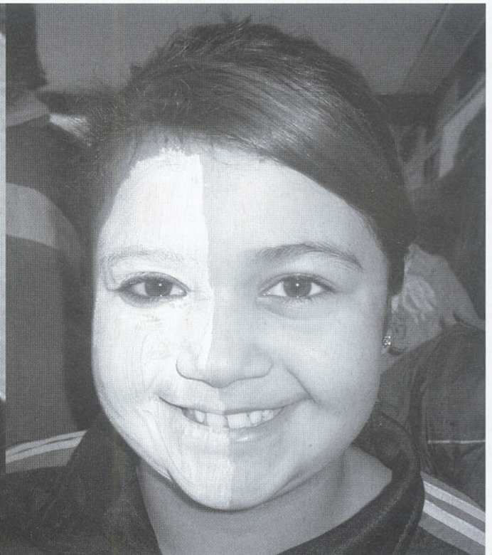
2007: Schülerin der Paul-Gerhardt-Schule.