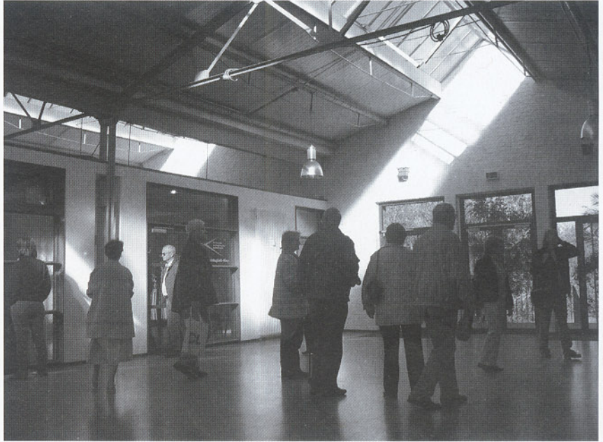
Die Eingangshalle - ein Ort für besondere Gelegenheiten

Im November wurde die Fabrik für Kultur und Stadtteil eingeweiht. In drei Jahren Umbauzeit wurde aus der ehemaligen papierverarbeitenden Fabrik ein modernes Zentrum für Kultur, Gewerbe, Dienstleistung und Stadtteilaktivitäten. Ein Schmuckstück in Düren Süd-Ost. Zahlreiche Firmen und Vereine sind bereits in die schönen komfortablen Räume zwischen der Binsfelder, Frieden- und Nörvenicher Straße eingezogen. 85 % der Fläche ist bereits vermietet. Schauen Sie es sich einfach mal an.